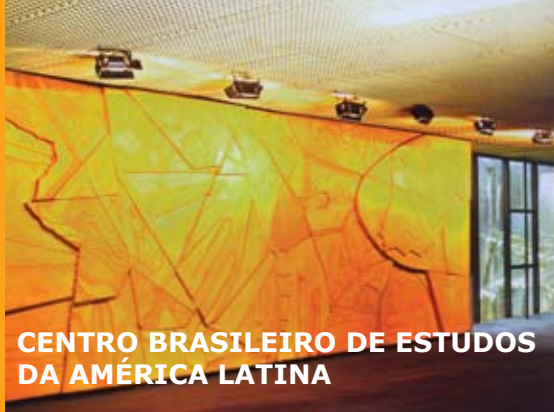
CENTRO BRASILEIRO DE ESTUDOS DA AMÉRICA LATINA